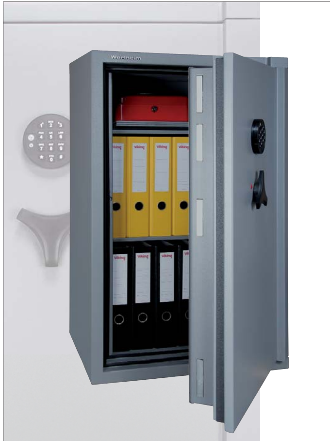
Abb. Wertschutzschrank CP25, Türbandung rechts E-Schloss M-Locks EM3520, 2 Fachböden